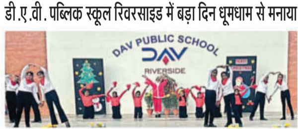
कार्यक्रम के दौरान मंच पर प्रस्तुति देते विद्यार्थी।

डी.ए.टी. पब्लिक स्कूल रिवरसाइड में बड़ा दिन धूमधाम से मनाया