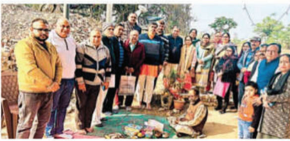
कार्यक्रम के दौरान समिति के सदस्य।