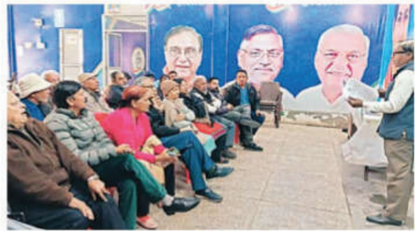
कांग्रेस भवन में बैठक के दौरान कांग्रेस कार्यकर्ता।