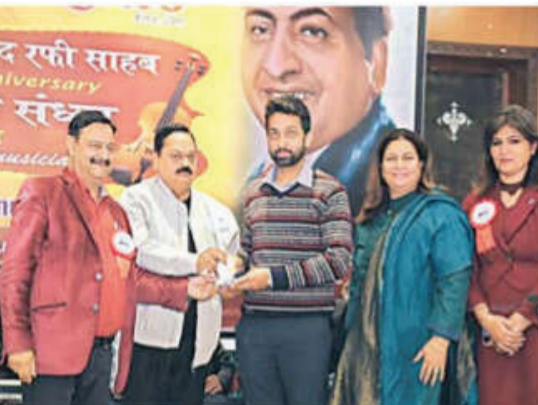
कार्यक्रम के दौरान मुख्यातिथि को सम्मानित करते क्लब के सदस्य तथा (दाएँ) दीप प्रज्वलित कर कार्यक्रम का शुभारम्भ करते मुख्यातिथि।